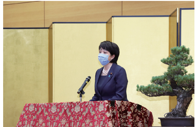
式辞を述べる高市総務大臣